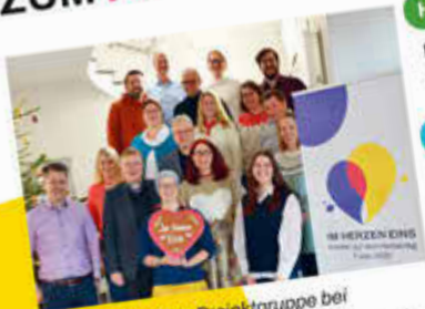
Die ökumenische Projektgruppe bei einem ihrer Vorbereitungstreffen.

Zum Hessentag 2026 (12.–21. Juni) gestalten die Kirchen in Fulda unter dem Motto „ Im Herzen eins “ ein gemeinsames ökumenisches Programm. Begegnung, Glauben und Gemeinschaft stehen im Mittelpunkt – getragen von Verbundenheit über Konfessions-, Herkunfts- und Lebensgrenzen hinweg.